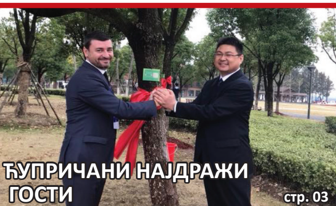
ЋУПРИЧАНИ НАЈДРАЖИ ГОСТИ