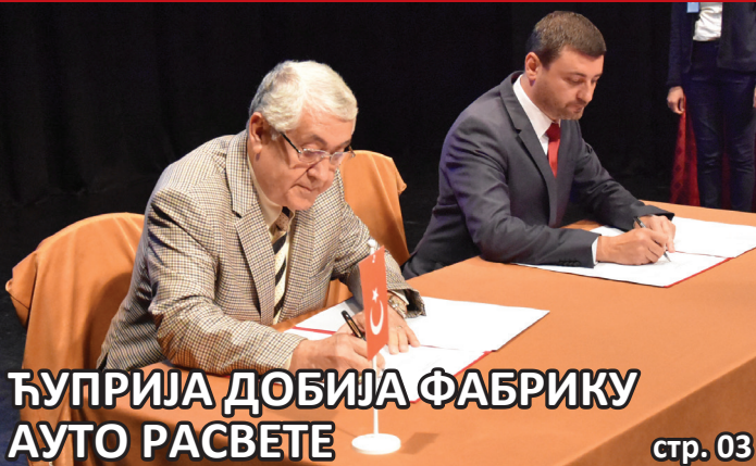
ЋУПРИЈА ДОБИЈА ФАБРИКУ АУТО РАСВЕТЕ