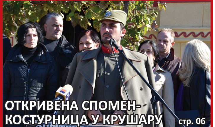
ОТКРИВЕНА СПОМЕН- КОСТУРНИЦА У КРУШАРУ