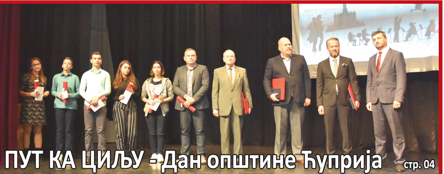
ПУТ КА ЦИЉУ - Дан општине Ћуприја